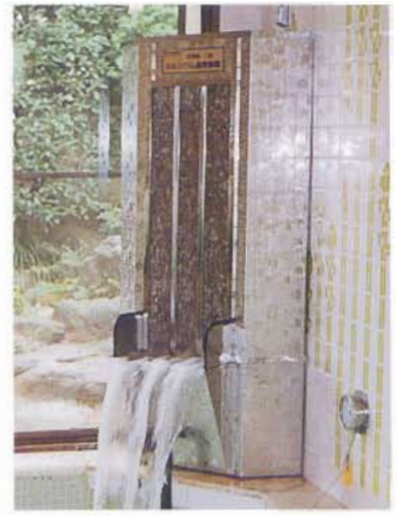
特許人工温泉装置 [第2528423号]